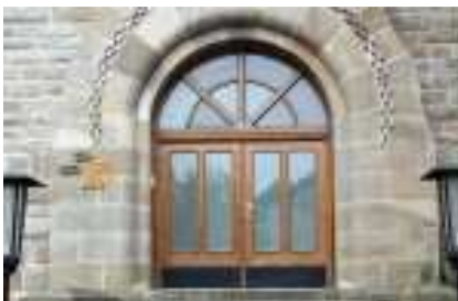
Max-Reger-Musikschule der Stadt Hagen

Nach allen Liedern aus dem ersten Band „5 + 6 = 12?“ lernte er viele Klavierstücke im Spiegelsystem, so wie sie in „OTTO, ANNA + IXIMIXI“ erschienen sind. Ob er aber mit beiden Händen unterschiedliche Stimmen gleichzeitig spielen könnte, war sehr fraglich. Für ein ganzes Schuljahr (2003 / 2004) wurde in Absprache mit der